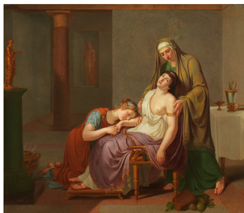
Heinrich Schmidt (Saarburg 1740 – Darmstad 1821) MORTE DI CLEOPATRA Olio su tela; firmato e datato 1797; cm 97 x 112 stima 25.000/30.000 euro