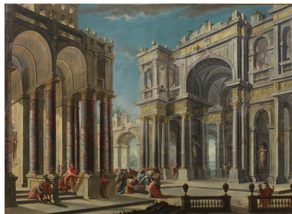
Alberto Carlieri PROSPETTIVA ARCHITETTONICA Olio su tela; cm 175 x 240 stima 50.000/70.000 euro