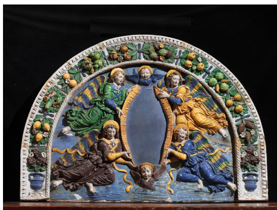
Giovanni Della Robbia (Firenze 1469 – 1529/30) LUNETTA Terracotta policroma stima 40.000/60.000 euro