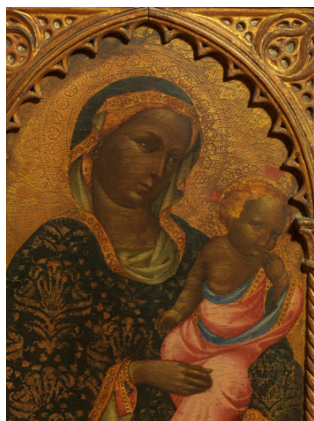
Jacobello del Fiore (Venezia, 1370 circa-1439) MADONNA COL BAMBINO Tempera su tavola; cm 55 x 36,5; in cornice 75 x 49,5 stima 120.000/150.000 euro