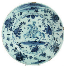
Albissola, Melchiorre Conrado, seconda metà del XVII secolo

Da non dimenticare la presenza di quattro lotti composti ognuno da 13, 11, 9 e 9 mattonelle tutte del XVI secolo in maiolica usate per la decorazione dei edifici su pareti e pavimenti. Di sicura origine orientale, come per altro si evince dal nome che in arabo è Al Zuleja , in spagnolo Azulejo e in ligure Laggioni, proprio questi 42 laggioni sono stati ampiamente studiati e pubblicati dal Cameirana, nonché pubblicati in Azulejos e Laggioni - Atlante delle piastrelle in Liguria dal Medioevo al XVI secolo di Loredana Pessa e Paolo Ramagli.