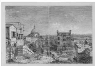
Canaletto VEDUTA IMMAGINARIA DI VENEZIA Acquaforte Stima 5.000/6.000 euro

Completa la vendita una selezione di atlanti che include una copia con leggio dell'ATLAS NOUVEAU di Sanson del 1696 a catalogo con la stima di 5.000/6.000 euro.