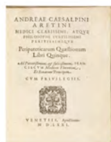
Andrea Cesalpino PERIPATETICARUM QUESTIONUM LIBRI QUINQUE, 1571 Stima 20.000/25.000 euro