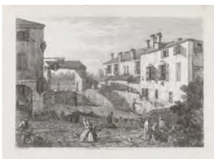
Canaletto LE PORTE DEL DOLO Acquaforte Stima 5.000/6.000 euro