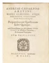
Andrea Cesalpino PERIPATETICARUM QUESTIONUM LIBRI QUINQUE, 1571 Stima 20.000/25.000 euro