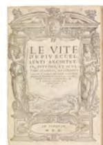
VITE DEL VASARI, 1550 Stima 8.500/11.500 euro