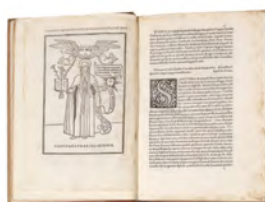
Andrea Cesalpino EPISTOLE DI SANTA CATERINA, 1500 Stima 5.500/6.500 euro