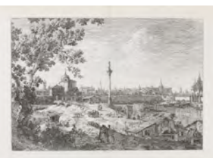
Canaletto VEDUTA IMMAGINARIA DI PADOVA Acquaforte Stima 5.000/6.000 euro