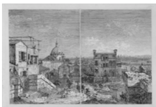
Canaletto VEDUTA IMMAGINARIA DI VENEZIA Acquaforte Stima 5.000/6.000 euro

Completa la vendita una selezione di atlanti che include una copia con leggenda dell'ATLAS NOUVEAU di Sanson del 1696 a catalogo con la stima di 5.000/6.000 euro.