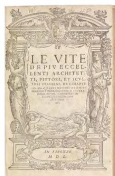
Giorgio Vasari, 1550 LE VITE DE PIÙ CELEBRI...