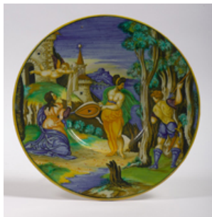
Francesco Xanto Avelli