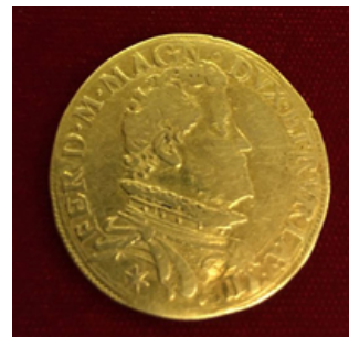
Doppia da due