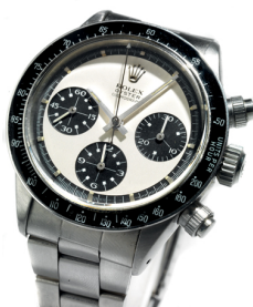
Rolex Cosmograph Daytona