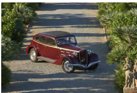
Alfa Romeo 6C 2300

La vendita di Pandolfini a Villa La Massa il 27 settembre presenterà, in effetti, una grande varietà di automobili, in grado di suscitare l'interesse di tutti gli appassionati, e di tutte le tasche.