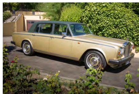
Rolls-Royce Silver Wraith II