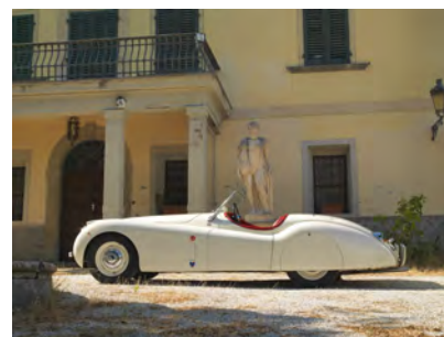
Jaguar XK 120