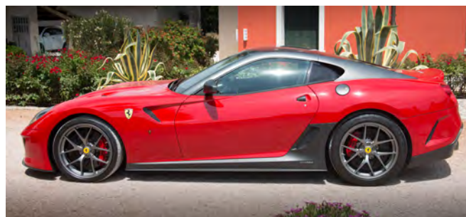
Ferrari 599 GTO