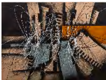
Roberto Crippa SPIRALE, 1951 olio su tela, cm 60x80 sul retro: firmato, datato e titolato Stima 25.000/35.000 euro