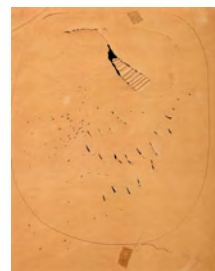
Lucio Fontana CONCETTO SPAZIALE, 1949 penna a sfera, buchi, strappi su carta, cm 33x22,5 firmato e datato in basso a destra Stima 14.000/24.000 euro