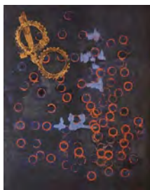
Giulio Turcato COMPOSIZIONE CON INGRANAGGI, 1962 olio su tela e collage, cm 150x120 firmato in basso a destra Stima 35.000/65.000 euro