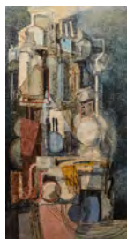
Afro Basaldella RAFFINERIA, 1951 olio su tela, cm 150x78 firmato in basso a destra "Afro '51" Stima 38.000/58.000 euro