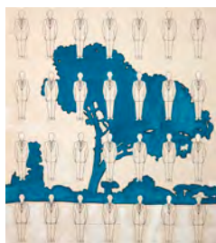
Renato Mambor UOMO E PAESAGGIO, 1978 vernice e pennarello su cartoncino, cm 68x60,5 sul retro: firma e iscrizione Stima 3.200/6.500 euro