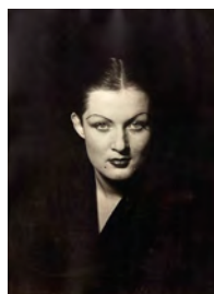
Man Ray FEMMES, 1981 stampa fotografica da negativo originale di Man Ray cm 29x21 stampa: Studio Mario Carrieri, Paolo Vandrash gennaio 1981 edizione autorizzata da Mrs Juliet Man Ray esemplare 32/35 Stima 6.000/9.000 euro